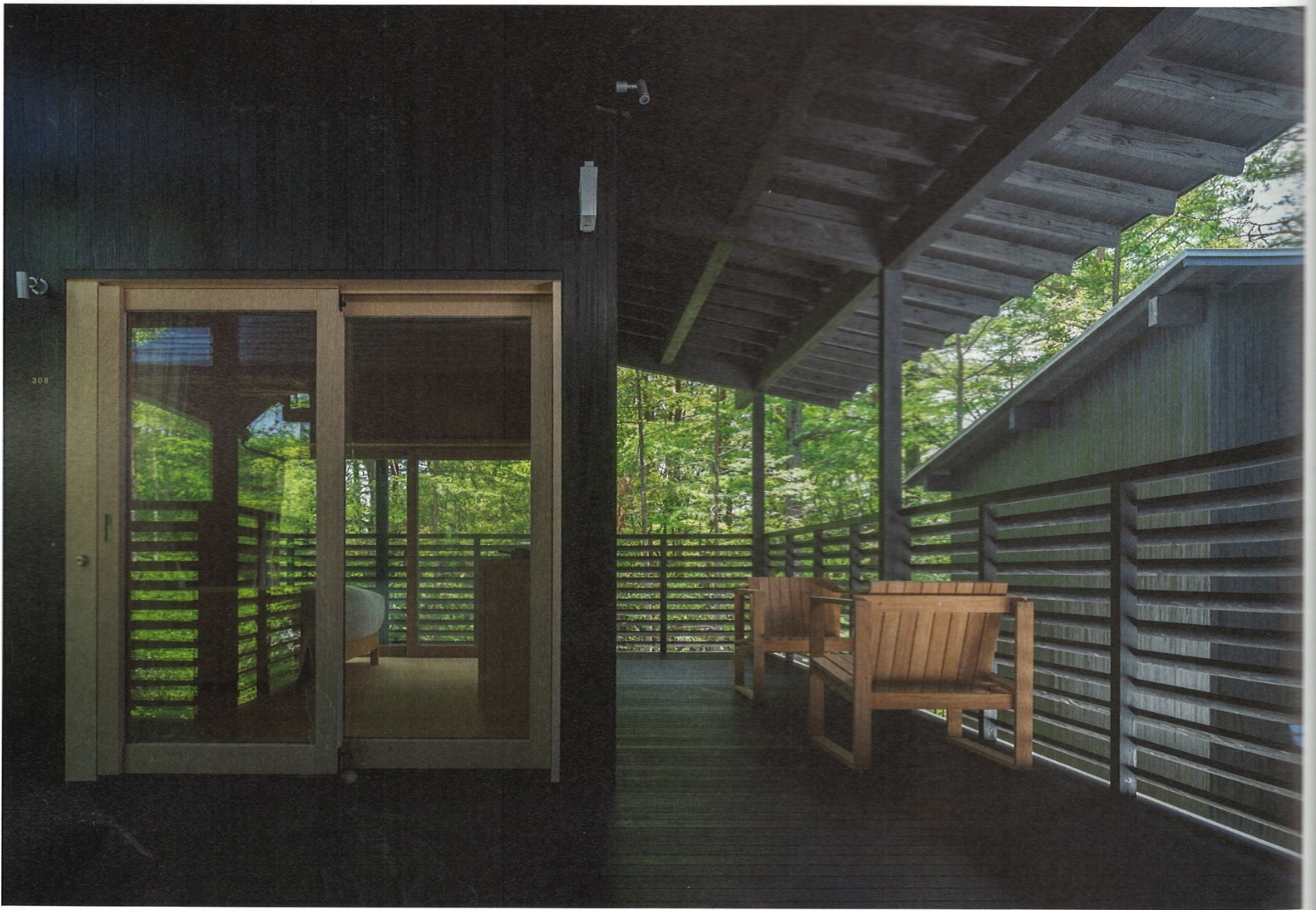
2階回廊と客室。棟ごとに2/10勾配の屋根が異なる向きで架かる。