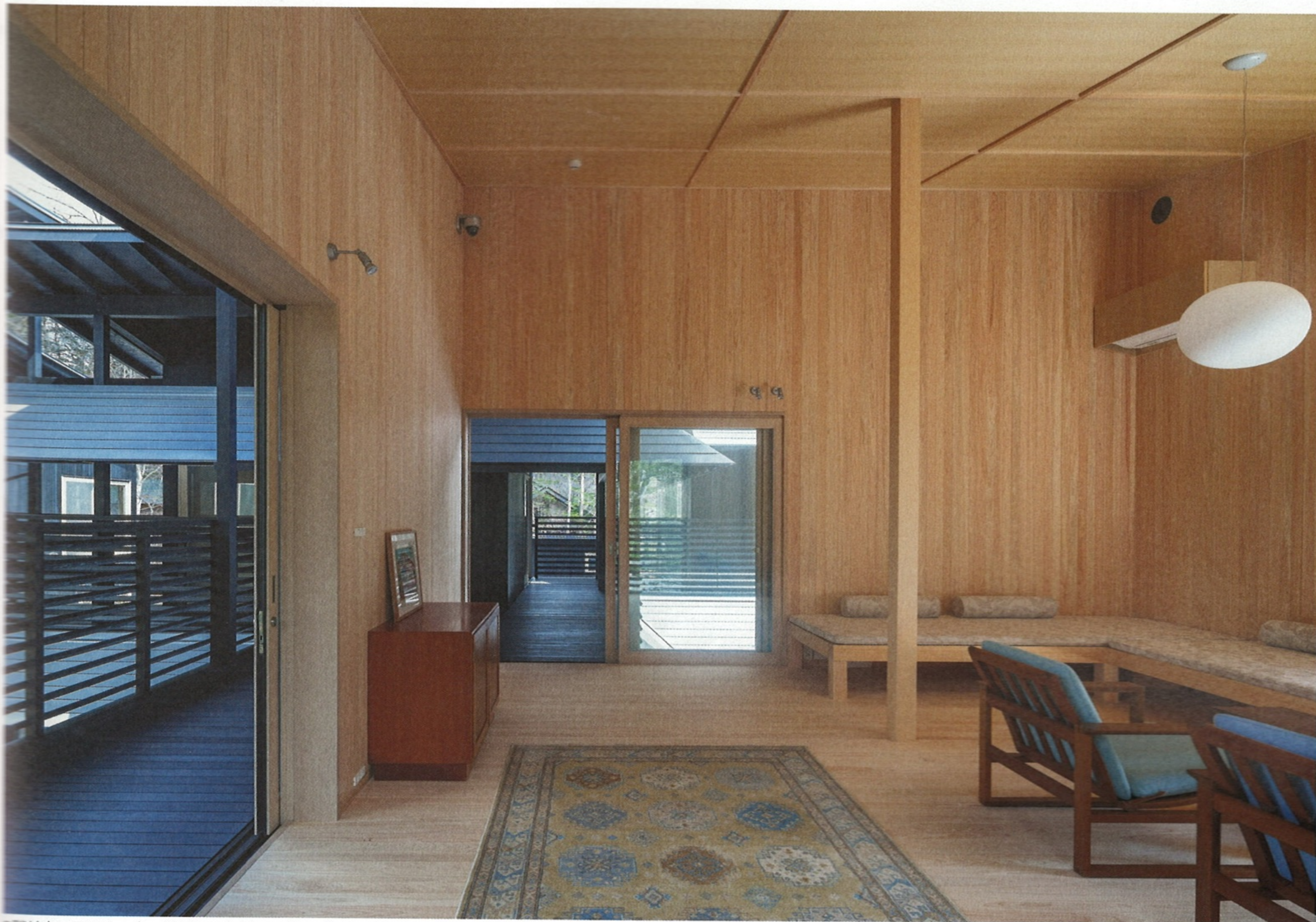
2階サウステラス。床・壁はヒノキ材，天井はダイライト仕上げ。天井高は2,900～3,800mm。各部屋は四方に開口を持つ。