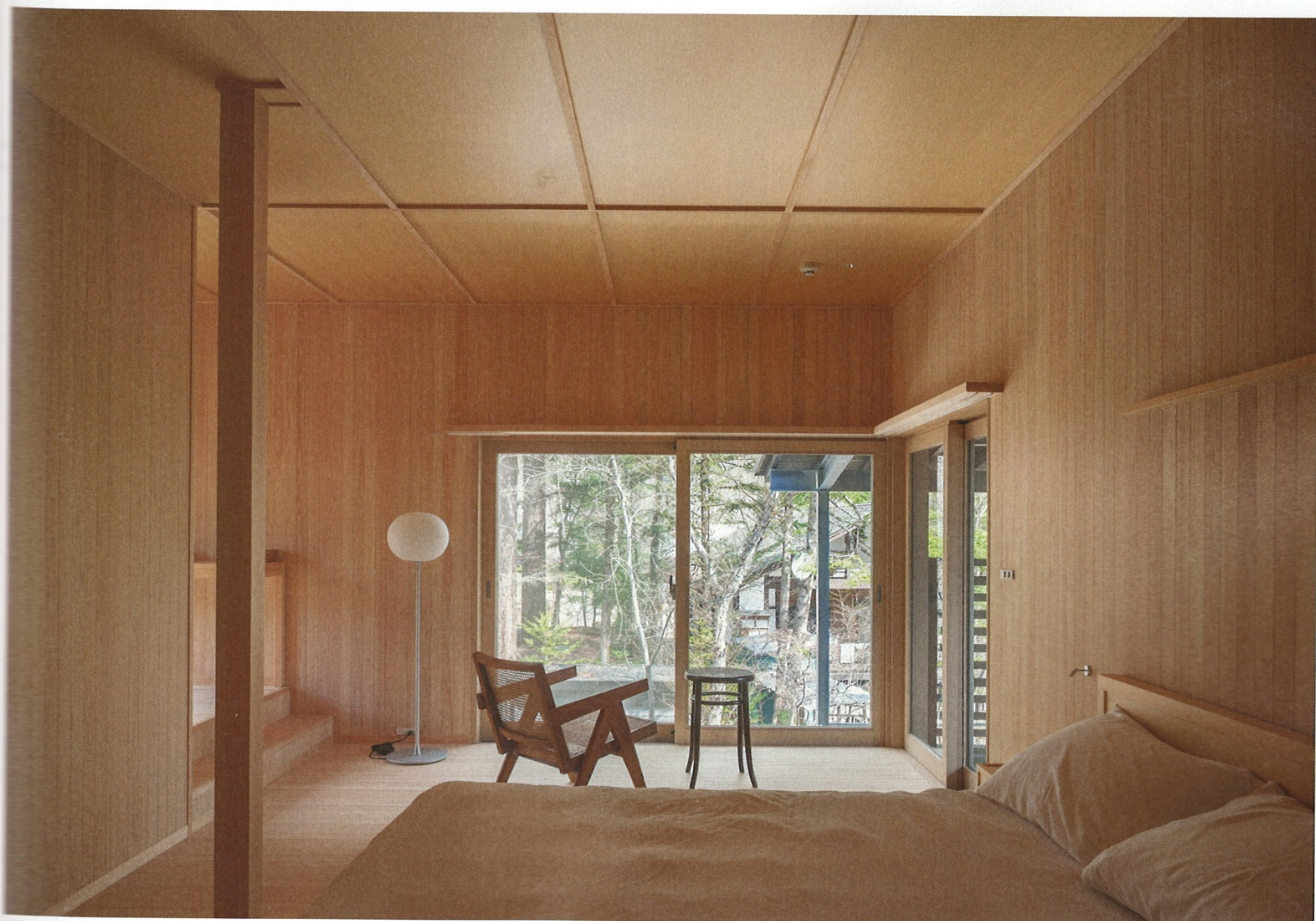
2階客室。各部屋の平面は910mmをモジュールとした。