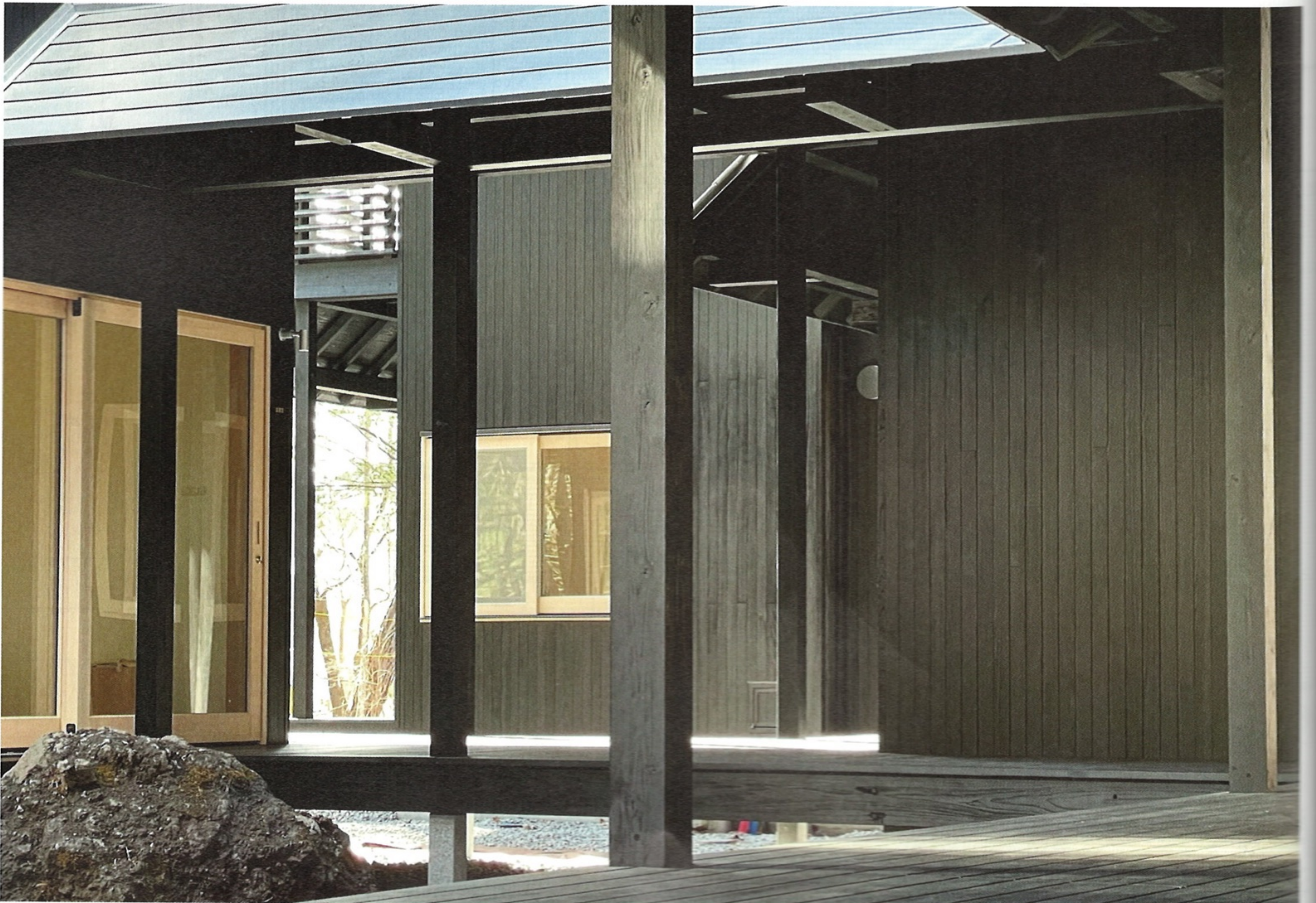
1階回廊。中庭には浅間石や樹木を配置。*